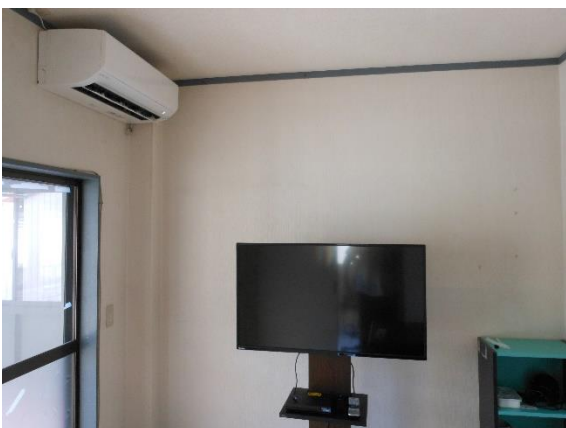
2 F 洋 4.5 帖