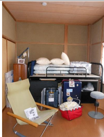
2F 洋 7.5 帖