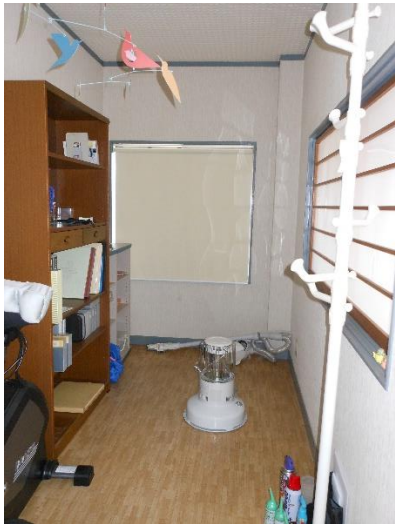
2 F ホール