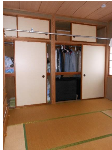
2 F 和 6 帖、