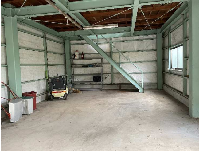
車庫 1 階