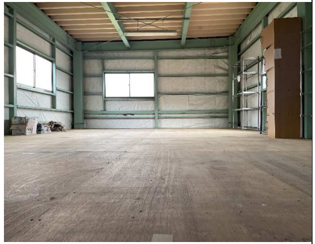
車庫 2 階