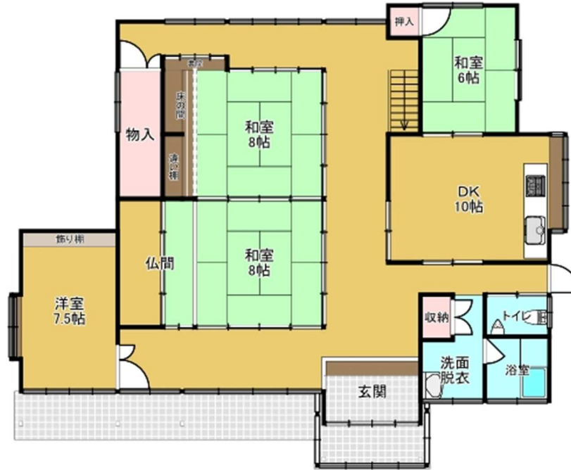
【 1F 】