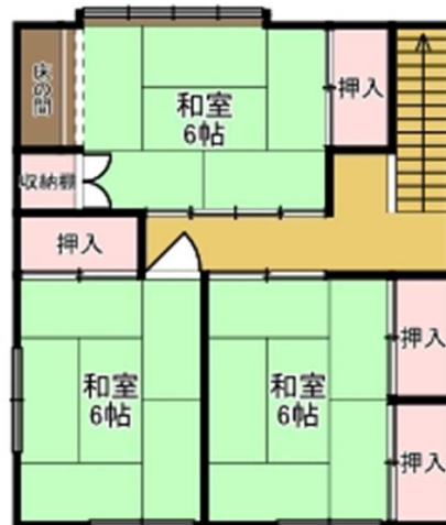
【 2F 】

○ わかりやすい間取り図作成をお願いします。手書きの場合、方眼紙等を活用してください。